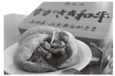
長崎和牛カレーぱん