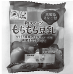
もちもち豆乳和スイーツ