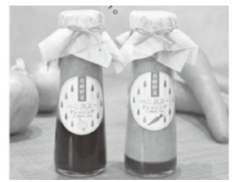
べじ食べ〜ドレッシング

1本/1,500円(税抜) ●長工醤油味噌(協)大村工場 ☎0957-53-4678