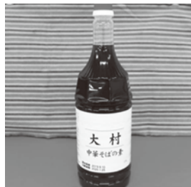
大村中華そばの素

1個/300円(税込) ●BOULANGERIE035 ☎080-5245-3080