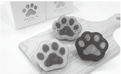
ながさき にゃどれーぬ

箱入り(2個)/300円(税込) 1個 /120円(税込) ●(社福)蓬菜会SAKURA+ ☎0957-56-9670