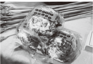
キャロットスパイス

1個/300円(税込) ●BOULANGERIE035 ☎080-5245-3080