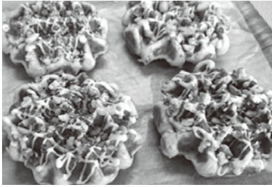
ピーナッツワッフル

惜しくも受賞には届かなかったものの、どれもがアイデアに溢れる素晴らしい商品ばかりでした。余すことなくご紹介します！