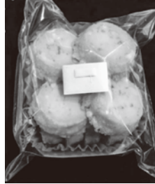
大村らっかせいクッキー