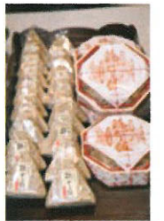
【優秀賞 実行委員長賞】 (有)大村寿可きおん本舗 商品名:おばあちゃんの 鶏つきあげ