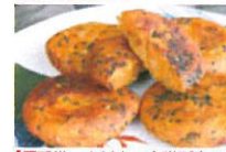
【優秀賞 大村商工会議所会頭賞】 鈴田畔農園(有) 鶏ピー飯(落花生入り鶏飯)