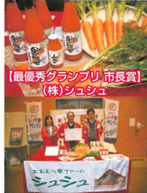
【最優秀グランプリ 市長賞】 (株)シュシュ