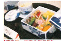
【優秀賞 市議会議長賞】 お料理 やまうえ 大村ものがたり