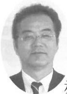
2号議員 赤野 利信氏