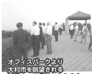
オフィスパークより 大村市を眺望される 観光コース参加のみなさん