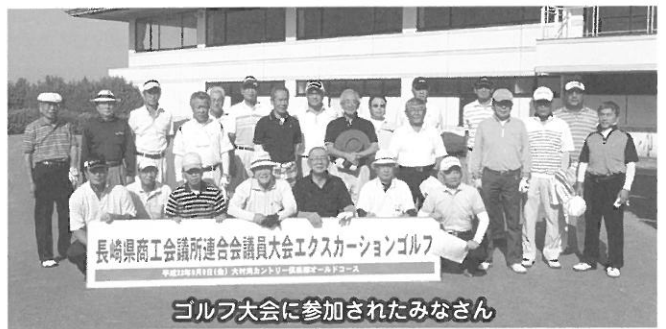
ゴルフ大会に参加されたみなさん