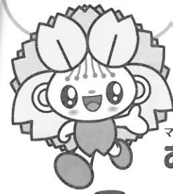
大村市 マスコットキャラクター おむらん ちゃん

1,000円で1,100円のお食事が できるお得なチケットだよ ぜひ、買いにきてね。