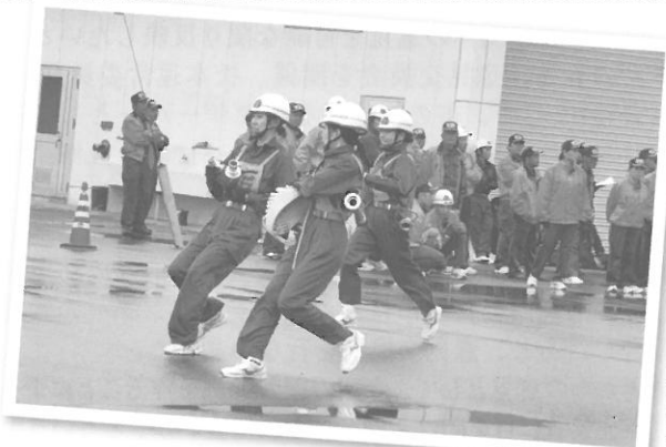
●放水競技大会女性団員