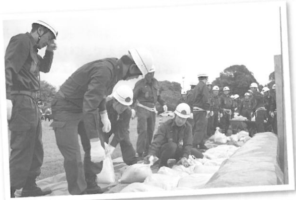
●水防訓練男性団員

消防団は、火災時の消火活動や、風水害などの発生に伴う警戒巡視、避難誘導、そして自然災害発生後の防御活動、と地域の安心・安全を守るための重要な役割を担っています。大災害になればなるほど、地域の消防団なしでは災害に対する救援活動は困難であり、まさに地域になくてはならない消防団です。