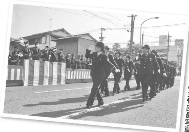
●出初式分列行進時の女性団員写真

また、各地区の分団とは別に18人の女性消防団員も男性団員と同様に各種の訓練に参加するほか、人命救助に関わる救命講習会において消防署救急救命士の補助員として参加し、また火災予防週間中には独居高齢者宅を訪問するなど防火啓発活動にも取り組んでいます。