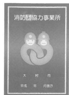
●消防団協力事業所表示証

※大村市HP ( http://www.city.omura.nagasaki.jp/ )、くらしと生活環境の(消防・防災)で紹介しております。 ※問合せ 大村市役所 0957-53-4111(安全対策課まで)