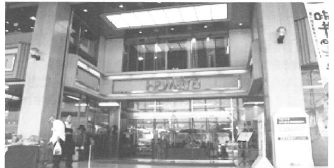
来年3月末で閉店する浜屋百貨店大村店=大村市本町

1983年に(株)浜屋百貨店の子会社として開業して以来、中央商店街アーケードのシンボルとして一時代を築いてきた大村浜屋(現在は支店・浜屋百貨店大村店)の歴史に幕が下ろされます。