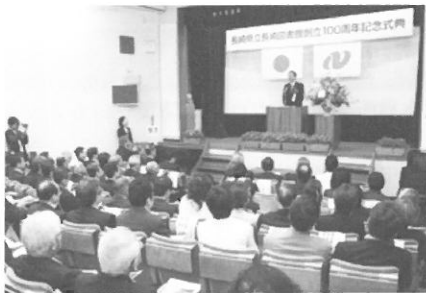
創立100周年を記念して開催された式典=長崎市、県立長崎図書館

1960年に新館として完成した今の建物は建設から50年以上が経過し老朽化が進んでいることなどから、建て替えが検討されており、県央である大村市も候補地として懸命に誘致活動を行っています。本年度中に建設場所が決定される方針です。