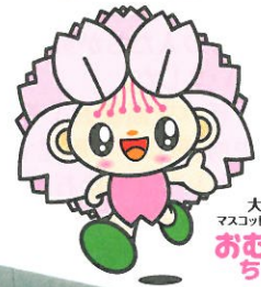
大村市 マスコットキャラクター おむらん ちゃん