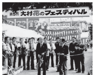
昭和60年頃の市立図書館前の広場の様子 緑豊かな郷土作りを目指しイベントを開催した

平成28年からは新しい大村市総合計画がスタートします。総合計画は市のバイブルのようなもので、その精神的な柱となるべきものが市民憲章ではないでしょうか。そういう意味では、市民憲章を見直す時期に来ており、新たな時代を切り拓く、市民共通の言葉が必要だと思えます。今後は、九州新幹線や、県立図書館、プロバスケットリーグへの参入など、大村市は転換期を迎えます。これまでは無かった視点や、市民協働のまちづくりがさらに重視されます。そのような時代だからこそ、その変化に対応した市民憲章にしていかねばならないと思えます。