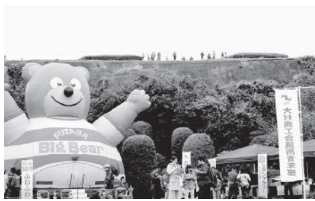
平成26年11月、空の日フェスタ内でイベントを開催 花文字山スタンプラリーや、空港の歴史写真などを展示した

多様な交通手段と豊富な駐車場施設そして大村湾の素晴らしい眺望が大きな強みとなります。大村の地形を活かしたイベントづくりや、地域のブランドینگなど可能性は広がり、長崎の玄関口としてさらに魅力を高めることができると思います。