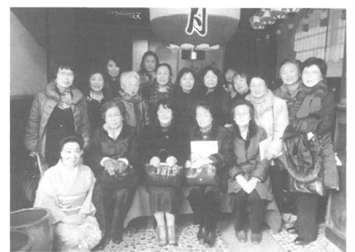
▲皆様のご入会をお待ちしています。

大村商工会議所女性会は、会員事業所の女性経営者や関係する女性の皆さんが一体となって、経営に携わる女性としての資質の向上や事業経営、自己啓発等にまい進するため、経営、経済、社会情勢、文化、環境問題、健康問題等、様々な分野