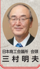
日本商工会議所 会頭 三村 明夫

昨年(2015年)の世界の動向は、ギリシャ問題、中国経済の新常态への移行、資源エネルギー価格の下落、シリア問題など、世界経済を揺るがす問題が多数ありました。新興国経済が低迷する中で、相対的に先進国経済は底堅く、米国経済は好調に推移し、昨年(2015年)の世界経済全体は緩やかな回復となりました。本年は、米国がよいよ金融緩和の出口戦略に入り、中国経済の先行きの不透明さと合わせて、新興国経済に力強さがうかがえないなど、世界経済の回復は今年も緩慢なものになるのではないかとみられて