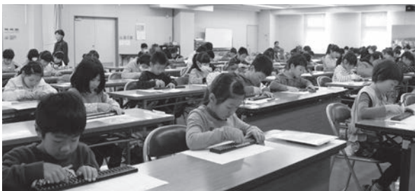
第34回級別大会で日頃の練習の成果を発揮する選手たち(大村商工会議所・大会議室)