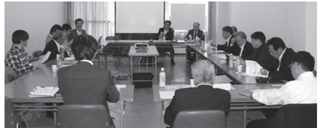
市新幹線まちづくり課より説明を受ける委員一行

委員会の中では、大村市に対して、新幹線整備事業が地元の業界と結びつくような形にしてほしい、新幹線整備事業において、地元企業を何らかの形にせよ、使うよう勧めたいと意見が出された。