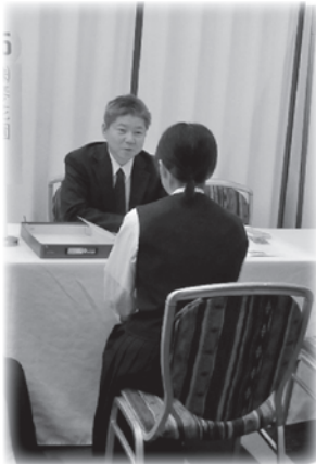
にこやかに面談する 株式会社琴花園のブースの様子

10月20日、諫早市内のホテルで平成30年3月新規高等学校卒業予定者合同企業面談会（県央会場）が開催され、参加企業が県内40社に対し、生徒25名（12校）が参加し、企業と面談しました。