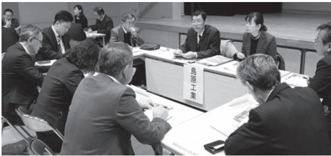
高校進路指導担当者と意見を交わす企業の担当者

大村工業高校始め、県内11校・17名の進路指導担当教諭・キャリアサポートスタッフの方と、県央地区52社の事業所が採用に向けた情報交換や人脈構築の場として、名刺交換や各事業所のPR、高校性の実情など意見を交わしました。(当所会員事業所から21事業所が参加)