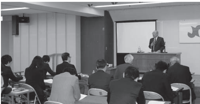
九州から株式公開できるベンチャーを育てることを熱く語る古賀氏

古賀氏は株式公開できるベンチャーを育てる事が地域おこしとなり、経済界の発展に繋がるとの持論を持たれ、九州からも多くの企業を株式上場を手助けされてきました。株式公開を目標とし、「目標は大きく」、「従業員を幸せにする」ことが企業の成長のポイントと指摘。また、新しい時代の経営として、顧客満足度・従業員満足度・経営者満足度を挙げ、従業員の満足度によって、企業は成長し、顧客満足度が上がる。経営者はお客様を満足させるために、従業員を満足させ、働きがいのある会社にする事が大事である、と熱く伝えられました。