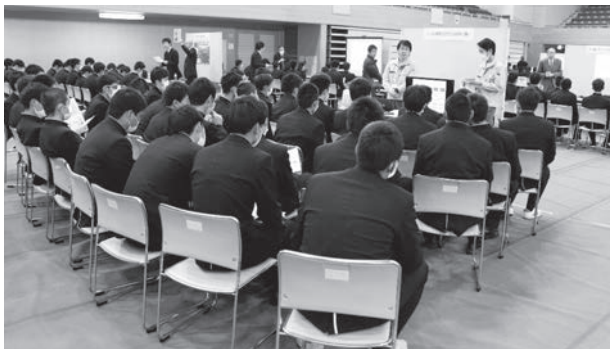
熱心に参加企業の代表・採用担当者から企業説明を聞く高校生

初の試みとなる企業説明会では、企業、高校生とも熱心に耳を傾けていました。また、長崎県央振興局より「長崎県就職応援BOOK」を創刊し、参加者に配られました。