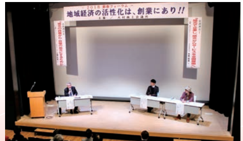
ディスカッションをする様子

フォーラム終了後は希望者で交流会を開き、名刺交換や情報交換を行い、盛会裏に終わりました。