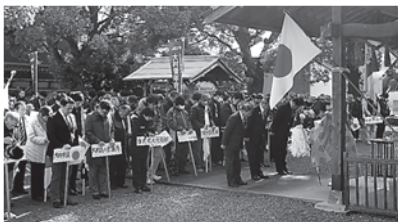
奉祝行事で 神事を受ける 一同