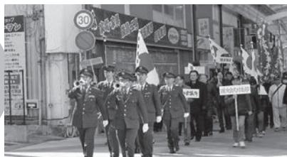
ラッパ隊を先頭に アーケード内を 行進する 参加者一同

大村市日の丸会(中村人久会長)では、2月11日(日)の建国記念日に西本町の皇大神宮で市民の集い奉祝行事を開催。約250名の関係者・市民の方々に参加いただき、建国の日を祝いました。