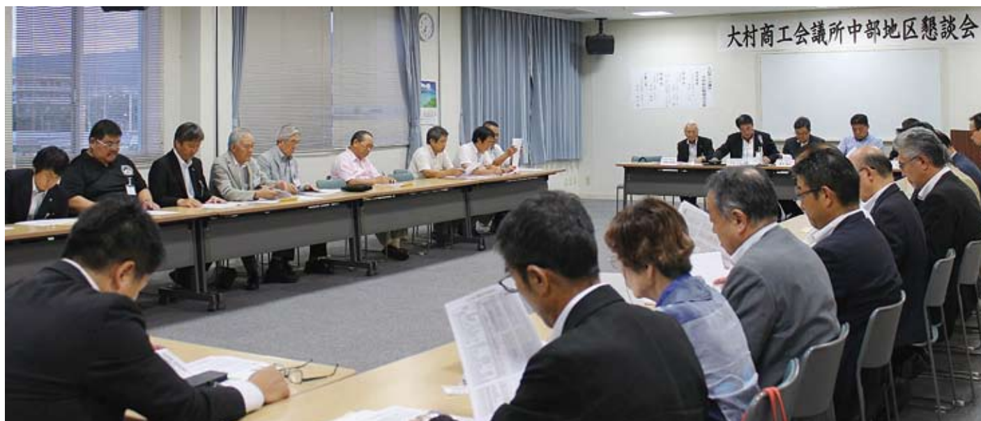
大村中部地区懇談会の様子(8月22日・サンスパ大村にて)

当所では昨年度に引き続き、北部地区懇談会を8月6日に、中部地区懇談会を8月22日に開催し、多くの会員の皆様と意見交換・交流を深めることができました。