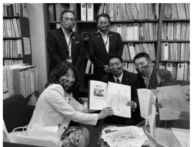
片山さつき参議院議員に要望書を手渡す期成会の一行