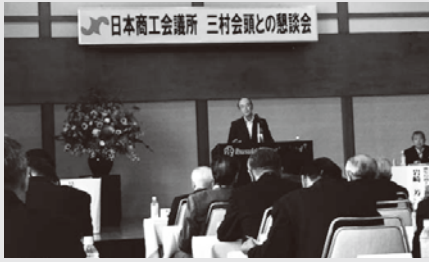
通常会員総会の様子