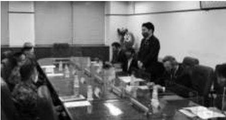
陸上自衛隊西部方面総監部へ要望書を提出する期成会の一行

また10月19日には、陸上自衛隊西部方面総監部を訪問し、同様の要望活動を行いました。