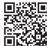
長崎県警察官募集 ホームページ

【試験日程】 ○第1次試験 10月20日(日) ○第2次試験 11月上旬~下旬 ○最終合格発表 12月中旬