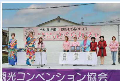
観光コンベンション協会