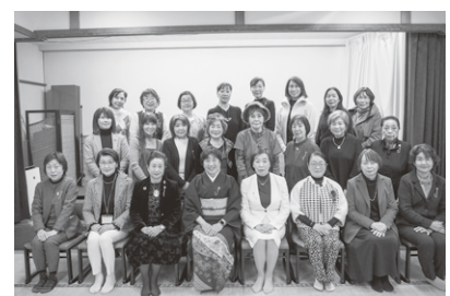
大川商工会議所女性会の皆様との集合写真

また、大川商工会議所女性会の事業の一環として「地元発見」で視察見学された「庄分酢」を紹介いただき、当会も視察見学を行いました。