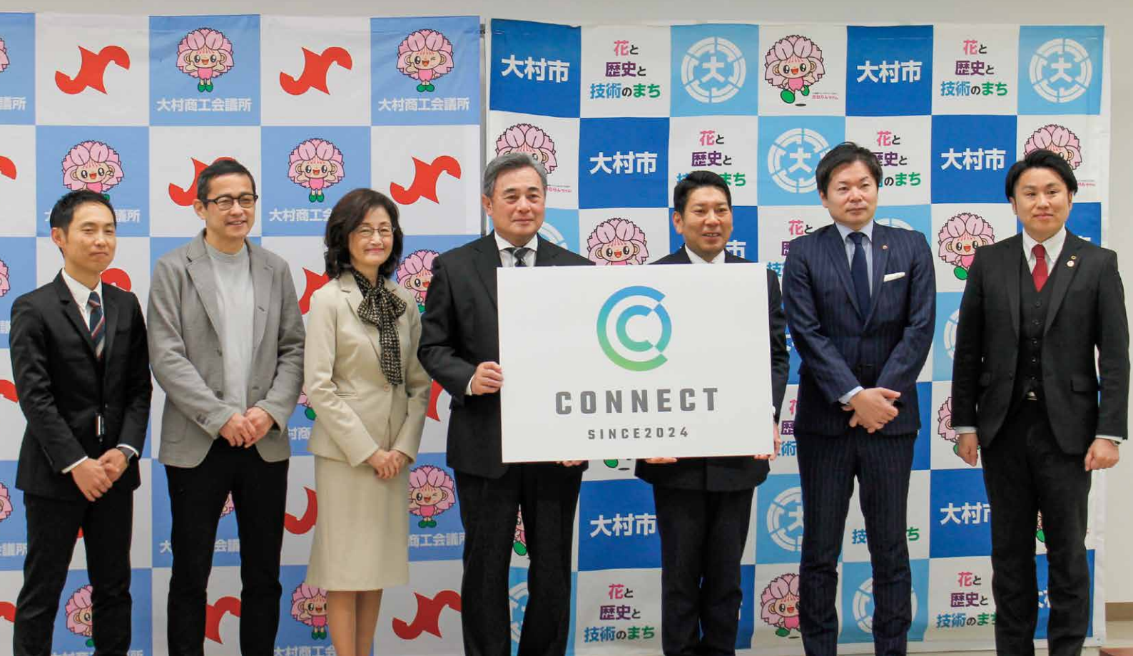
2月22日に設立を発表した皆様