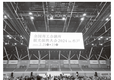
水戸大会 会場の様子

2日目の全体会議では開幕セレモニー、記念対談、クロージングを3部構成で実施され、2023年度全国商工会議所きらり輝き大賞表彰、水戸アピール採択など様々な議事が実施されました。今回の大会は、約1,900名と過去最高の参加者ということで大盛況の開催となりました。また、次年度開催地が長崎市に決定しており、長崎県下の会議所から40名が参加し、壇上での次期開催地アピールを行いました。