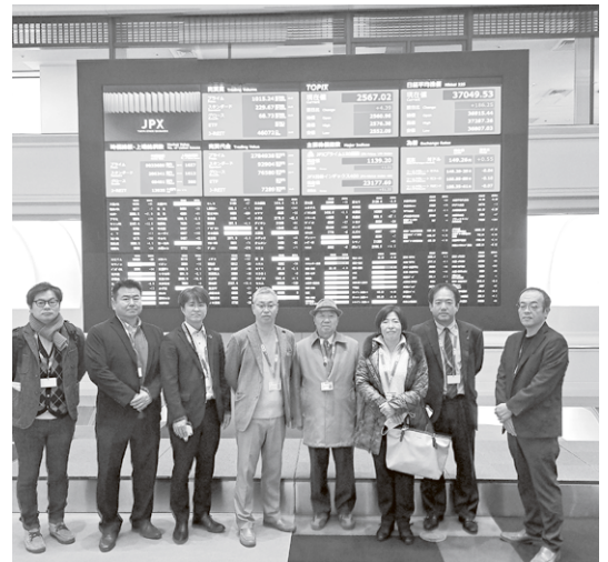
マーケットセンター内にて参加者の皆様

今回の視察は経済団体である商工会議所とくに理財部会にとって非常に興味深く、有意義な研修となりました。