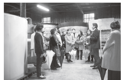
酢蔵（庄分酢）見学をする一行