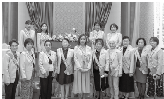
11月2日県商連女性会県大会・佐世保大会