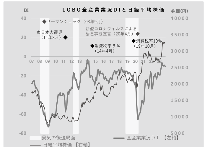
業況DI (※DI=「好転」の回答割合-「悪化」の回答割合)