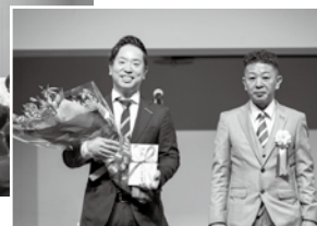
米良講師と野中長崎県連会長