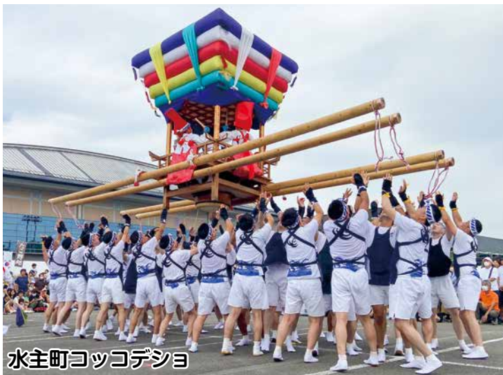
水主町コッコデシヨ

10月1日、ポートレースおおむら第5駐車場で「第23回おおむら秋まつり」を開催。伝統芸能の発表や各種催物、「ご当地自慢グルメフェアinおおむら 発見!探検!食ぶっけん!2023」が同時開催され、盛大のうちに終了しました。ご来場いただきました市民の皆様、誠にありがとうございました。