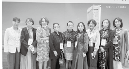
10月5日開催 新潟全国大会