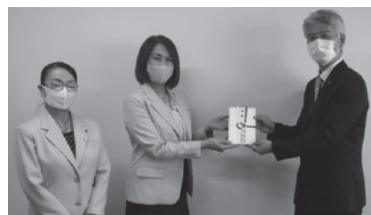
義援金贈呈で県庁を訪問

長崎県では、ロシアのウクライナへの軍事侵攻により、ウクライナから長崎県内へ避難された方への資金援助等に活用するための義援金を令和5年3月末まで受け付けています。