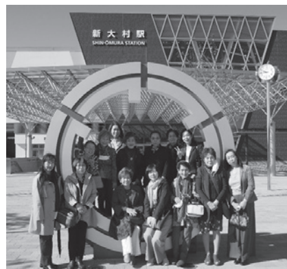
新大村駅前での集合写真

6月に開通前の新大村駅舎や大村車両基地駅を見学した上で、実際に開業した現在の新大村駅舎の様子を見学。また、長崎市役所職員の方から、出島メッセ長崎施設の説明を受け、コロナ禍での設計・建設により、最先端の換気システムを導入している等、世界に発信する長崎の施設を勉強する良い機会となりました。