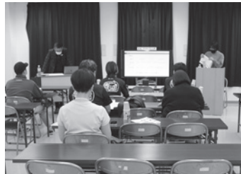
第3回セミナーの様様

また、10月23日（日）、コレモおおむらいイベント広場にて玖島中学校「くしまるシェ」と大村城南高校の「学フェス」の共同イベントが行われ、第10回グランプリ受賞商品4品目を出品しました。会場は大盛況で、準備したじげたま商品はいずれも完売。若い力で中央商店街を大いに盛り上げました。