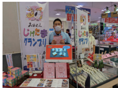
じげたま商品の並ぶうまいものフェア会場