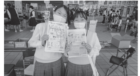
ご協力いただいた城南高校の皆様