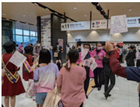
新大村駅利用者へのおもてなし