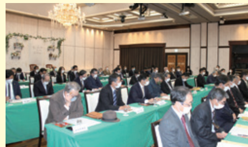
総会に集結した第32期役員・議員の皆様

私は副会頭時代を含めれば約13年に亘って大村商工会議所の運営に携わってきましたが、その中でも第31期は、コロナ禍の影響でキャッシュレス決済や対人接触を避けるリモートワークの普及など「レスの時代」に急速に突入し、事業者を取り巻く環境が大きく変化した3年間でした。この変化の激しい時代をどのように生き残っていくか、あらためて会員の皆様と考えていく必要があります。大村市は、新幹線発着駅、空港、高速道路のインターチェンジが二か所もあり、非常に恵まれた地域であると言えます。この「地の利」を活用し、いかにまちづくりを進めていくかが大きな課題です。その中でも、私が特に重視すべきと思うのは、子育て世代にとって過ごしやすい「育児のまち」を作ることであると考えています。日本が人口減少社会に突入する中で、未来を担う若い世代にとって住みよい大村市を創ることが、地域の力を高めていく重要な要素となります。その過程を、市民の代表である議会や行政、そして市内商工業者の意見を集約できる我々商工会議所、この3つの力を合わせて大村のまちづくりに取り組んでいきたいと思っていますので、今後も皆様のお知恵を十分にお貸しいただけますよう、何卒よろしくお願い致します。新たなメンバーを迎えた部会や委員会で、皆様のご協力を賜りながら進めていきますので、これから3年間よろしくお願い致します。