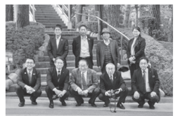
視察研修にお集まりの皆様

また、実際に社員の方々の朝の掃除や朝礼の風景、最先端の研究施設等を視察しました。「いい会社を作る」原点はそこで働く社員がイキイキとしているということです。社員重視の経営の延長線上に地域社会への貢献があるというお話は、今後の大村市の地域経済活性化を検討していく上で、大変参考になるものでした。